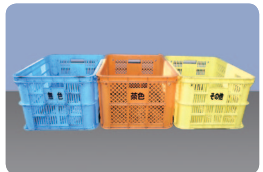
空きびん回収コンテナ